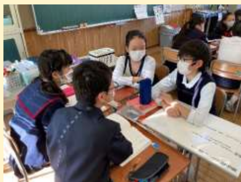
資料1 グループで話合っている姿