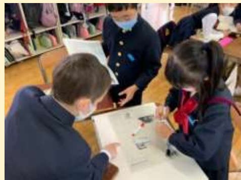
資料2 話し合いの様子