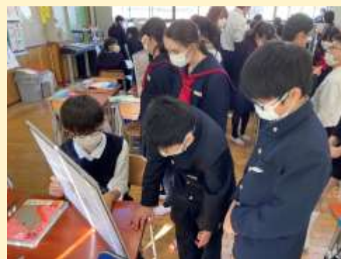
資料2 ワールドカフェ形式で説明している姿